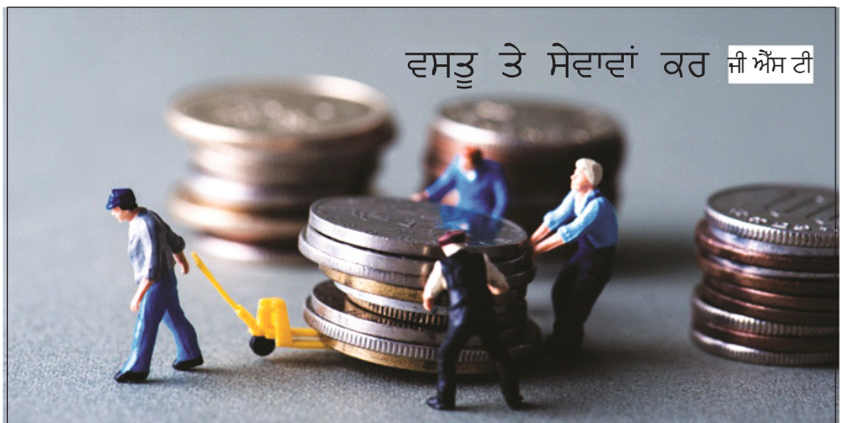
ਵਸਤੂ ਤੇ ਸੇਵਾਵਾਂ ਕਰ ਜੀ ਐੱਸ ਟੀ

ਜੀ ਐੱਸ ਟੀ ਲਾਗੂ ਕਰਨ ਅਤੇ ਉਸ ਦੇ ਨਾਲ-ਨਾਲ ਮੁਨਾਫ਼ਾਖੋਰੀ ਵਿਰੋਧੀ ਕਾਨੂੰਨ ਲਿਆਉਣ